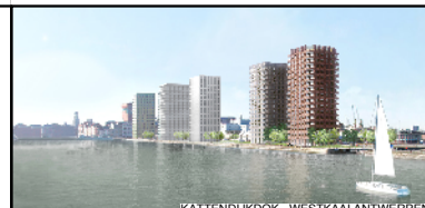
KATTENDIJKDOK - WESTKAAI ANTWERPEN